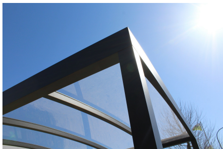
Helder polycarbonaat is 80-90% lichtdoorlatend

2) Maak je keuze voor je dakbekleding: in helder of opaal polycarbonaat. Wil je veel licht doorlaten of dit eerder beperken? Elke plaat heeft een UV-bescherm laag tegen vergeling.