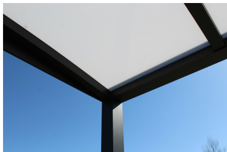
Opaal polycarbonaat is 20-30% lichtdoorlatend