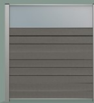
vitre opaque de 45 cm