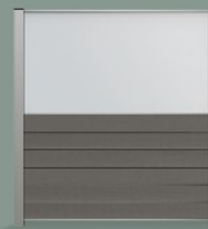
vitre claire de 90 cm